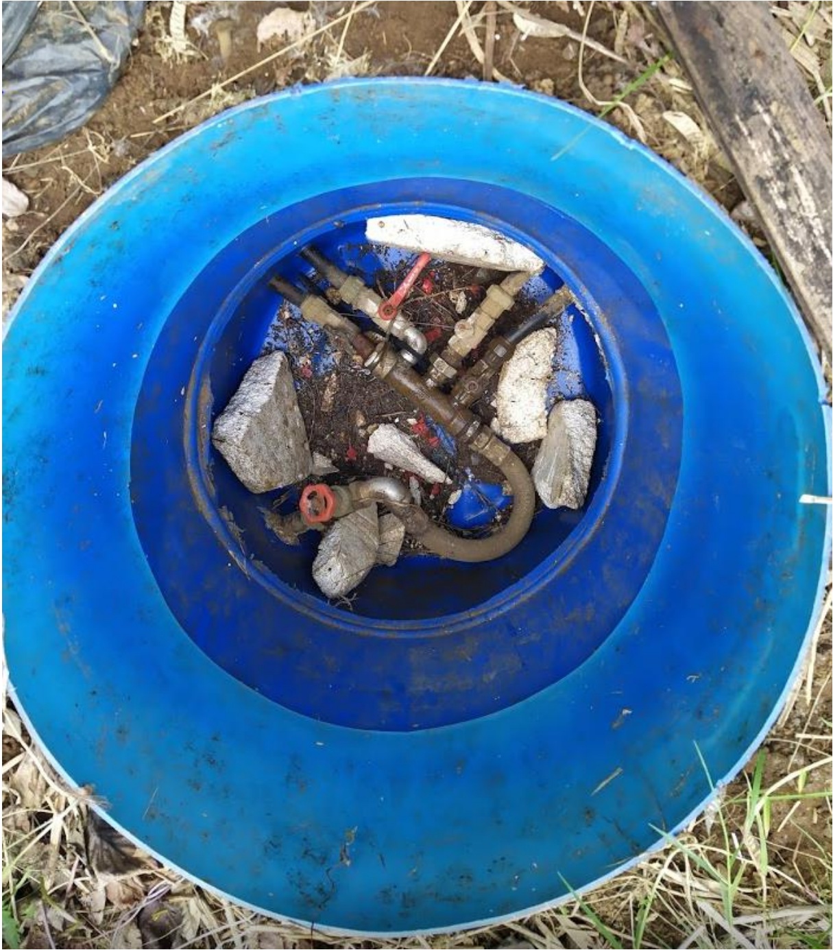
Mynd 2. Tengibrunnur T-3 nyrst á svæðinu, á lóðarmörkum 3 og 4.