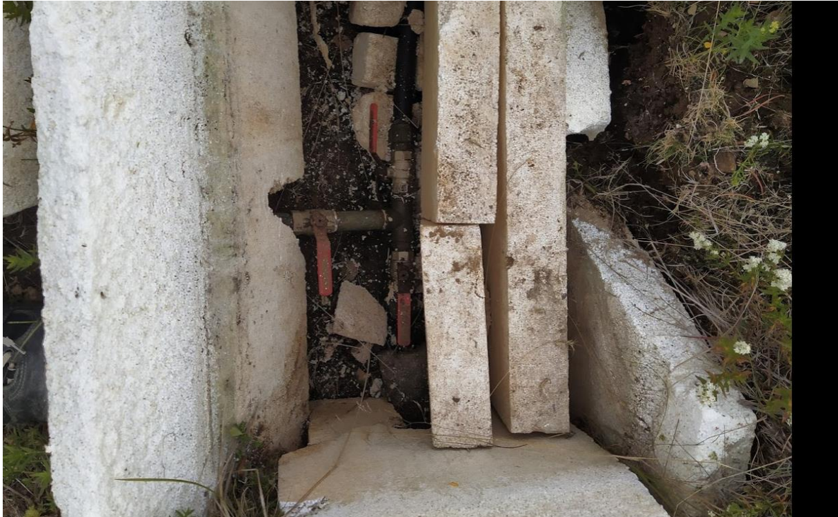
Mynd 4. Loki ofanjarðar skammt frá loka A-5. Einn leggur virðist koma frá loka A-5 og gengum té-stykkið og síðan gegnum ½" loka að húsi 40-41. Mið-leggurinn er stubbur um 1 m frá þessum búnaði og hægt að tæma lagnirnar.