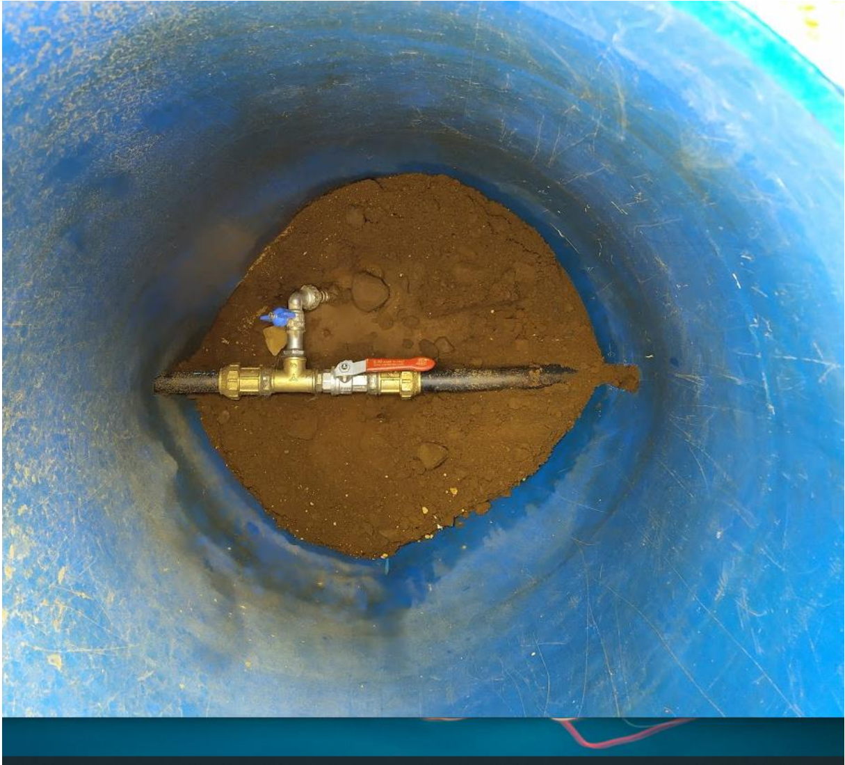
Mynd 5. Tenging í brunni inn á lóð #85. Grafið og sett upp af Jóni Þorgeiri. Samskonar útbúnaður er líklega á #90.