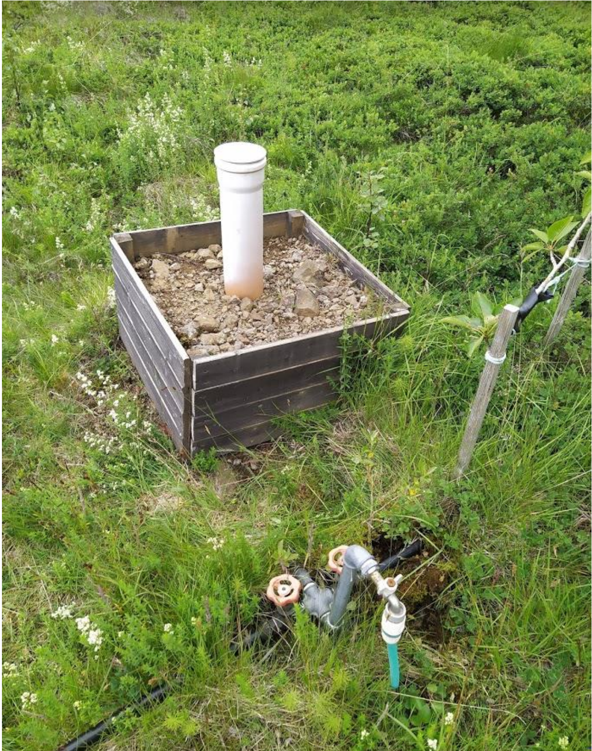
Mynd 3. Loki A-5 ofarlega í lóð #23. Lokinn er niðurgrafinn en lögnin tekin upp og liggur meira og minna ofanjarðar að húsum #22 og #23.